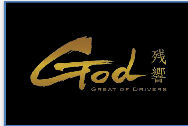
GOD 残響 大会スポンサー