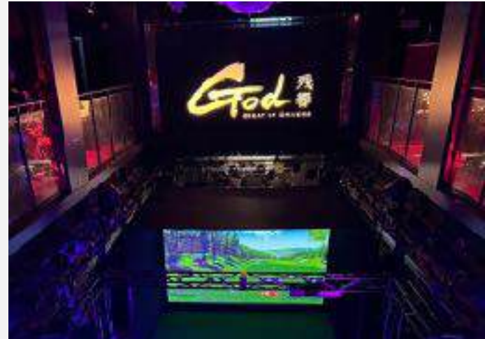
※2024年12月イベント会場画像